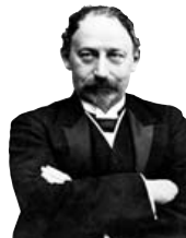
EDVARD BRANDES (1847-1931) STIFTER AF POLITIKEN I 1884