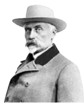
VIGGO HØRUP (1841-1902) STIFTER AF POLITIKEN I 1884

9 læserbrev og debatindlæg handlede om nye undervisningsformer i gymnasiet