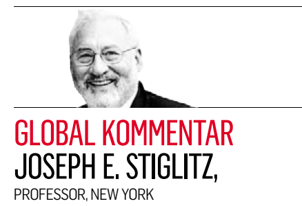
GLOBAL KOMMENTAR JOSEPH E. STIGLITZ, PROFESSOR, NEW YORK